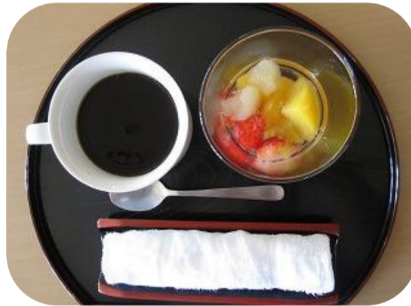
▲旬のいちごを使ったフルーツポンチ

来所時より、万歩計をつけて頂くことで、デイサービス利用中の歩行状態を記録に残しています。デイルームから出て施設内をあちこち散歩されることで新たな発見があったり、入居されている方との出会いがあったりと以前より活動的になられたと思います。また、皆様意識して足をしっかり上げて歩行されるようになりました。半日で三千歩歩かれた方もいらっしゃいました。思ったより利用者様に好評であり機能訓練の一環として、これからも続けていこうと思います。