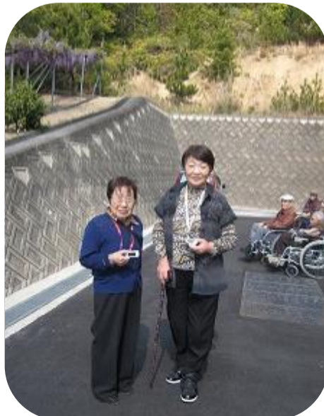
▲天気の良い日は外へお散歩へいきます。

四月から利用者様の生活機能訓練の一環として午前中におやつ作りを実施しています。杏仁豆腐やフルーツポンチなどフルーツ缶詰や、バナナなどを切って作っていただいたり、盛り付けも一緒にしていただいたりもこだわっています。トレーや器があるので、利用者様にカフェの気分を味わっていただき、とても好評です。