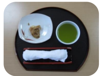
▲裏山で採れた筍の土佐煮