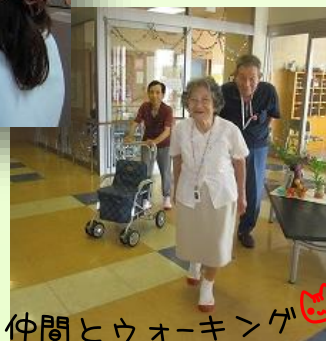
仲間とウォーキング

4月から1日500歩を目標に利用者様に朝万歩計をお渡しし、ディサービスで過ごしていただいています。5か月経過した現在は、個人ごとに目標の歩数を設定していただいています。