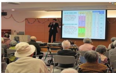
▲ 防犯教室(身近な犯罪の被害防止について)