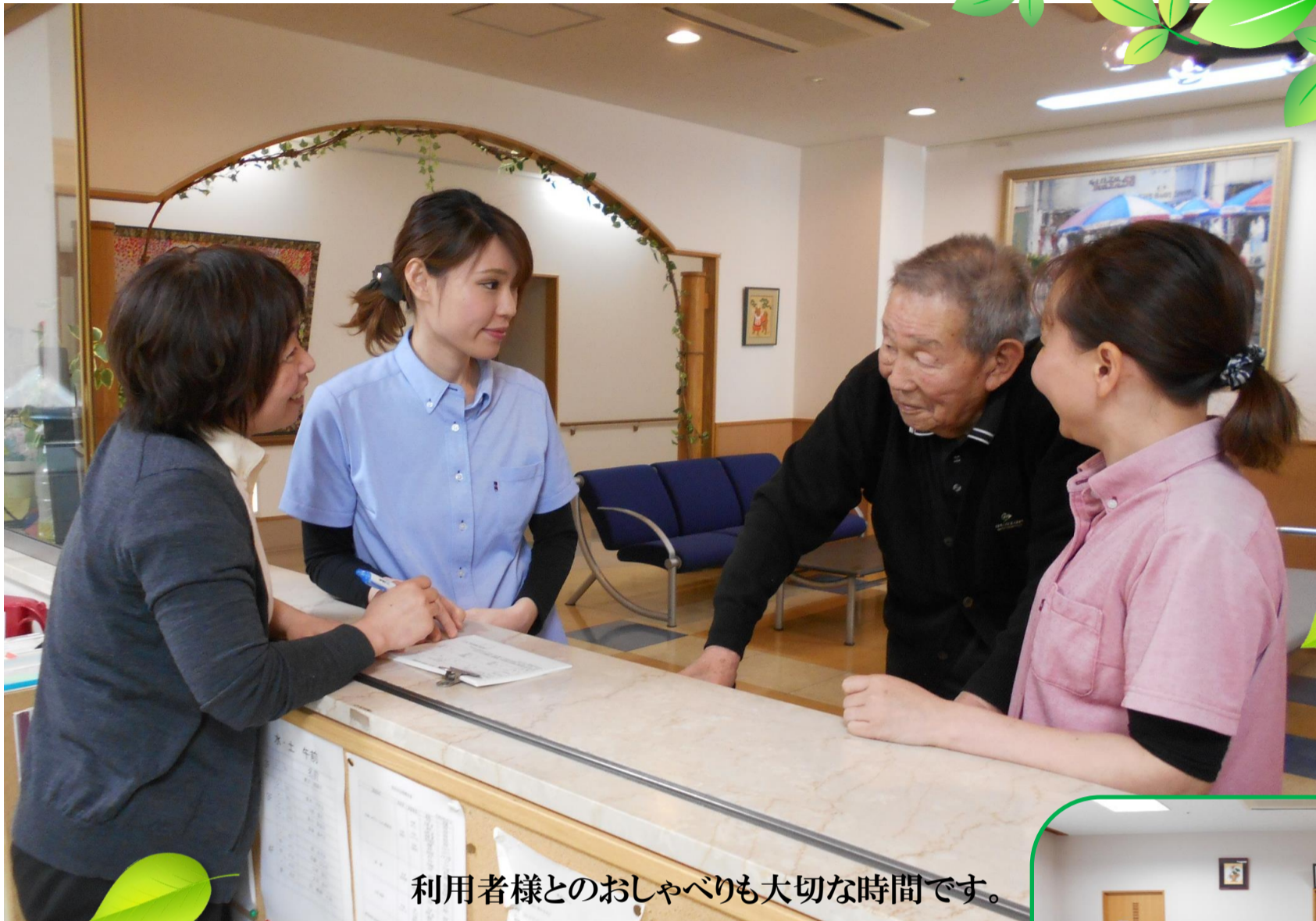
利用者様とのおしゃべりも大切な時間です。

住み慣れた地域で、施設のご利用者のご家族が、そして多くの人が幸せを感じられる空間を創造します。