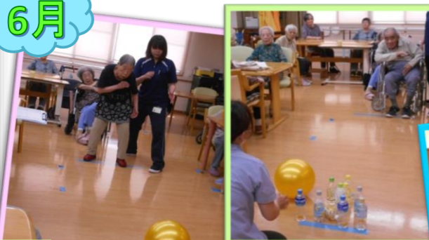
6月 ペットボトルでボーリング。何本たおせたかな？！