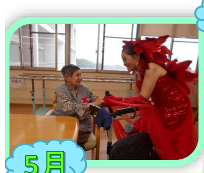
5月 美空ひばり歌謡ショー。。。 皆さん、芸達者です🎵