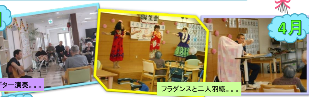
4月 フラダンスと二人羽織。。。