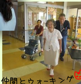
仲間とウォーキング

4月から1日500歩を目標に利用者様に朝万歩計をお渡しし、デイサービスで過ごしていただいております。5か月経過した現在は、個人ごとに目標の歩数を設定していただいております。