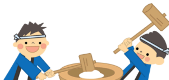
▼見よ！この腰つき。しっかり芯をたたきます。