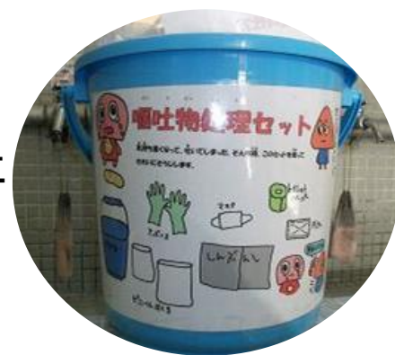
▲バケツの中に処理セットを用意し、もしものときに備えます。

特に乳幼児、高齢者では下痢、嘔吐にて脱水や嘔吐物にての窒息に気をつける必要があります。一度感染しても繰り返し感染することがあります。