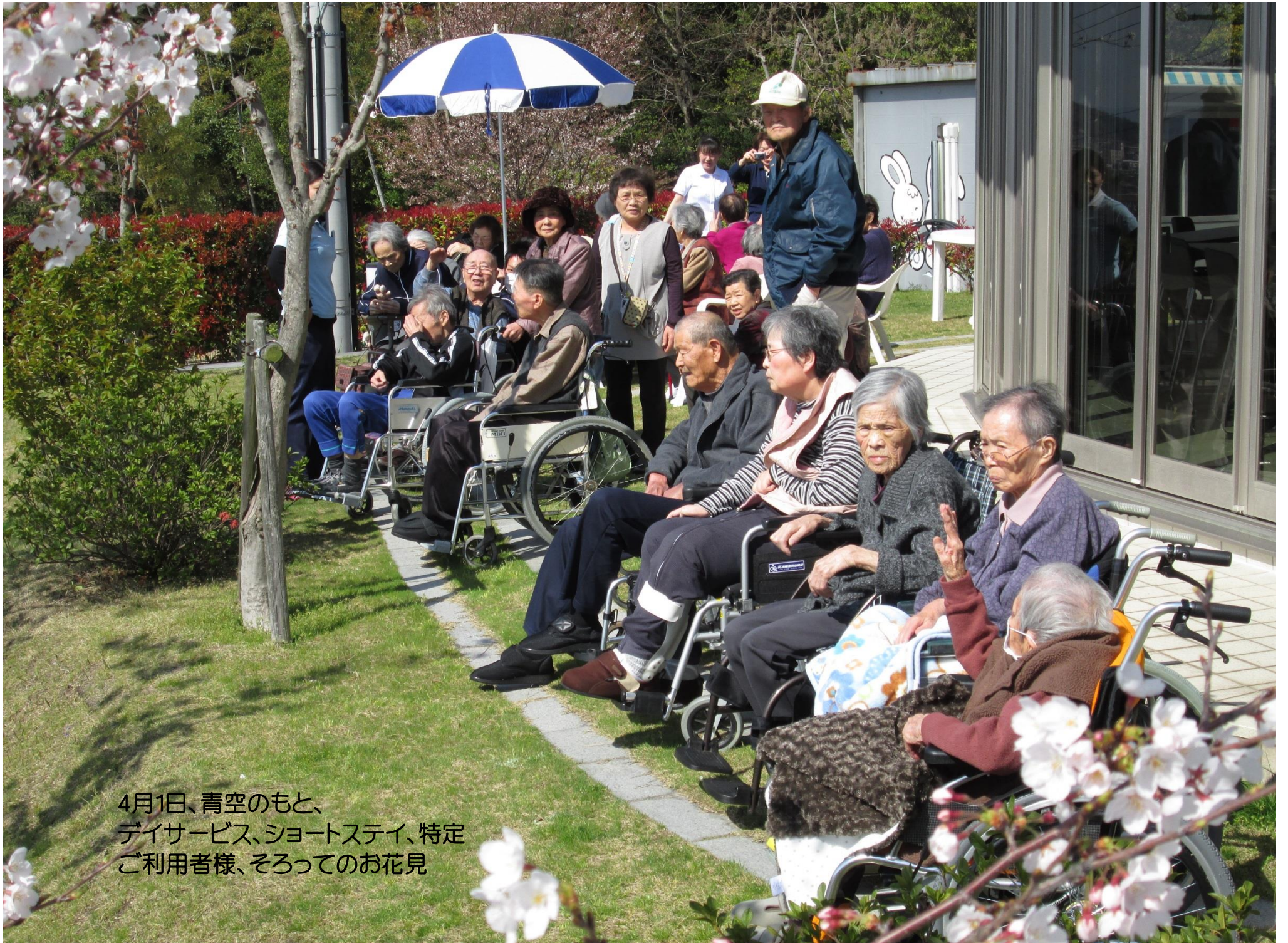
4月1日、青空のもと、 デイサービス、ショートステイ、特定 ご利用者様、そろってのお花見

住み慣れた地域で、 施設のご利用者のご家族が、そして多くの人が 幸せを感じられる空間を創造します。