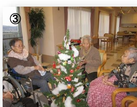
③ クリスマスツリーの飾り付け