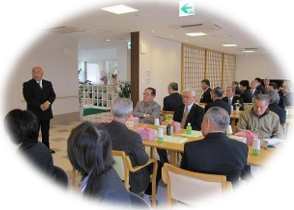
▲地元の方々を招いての内覧会(平成25年3月中旬)

一年前、ショートステイ開設に合わせて、吉祥の基本理念を一新しました。ショートステイ吉祥では、『住み慣れた地域で施設のご利用者と、ご家族が、そして多くの方が幸せを感じられる空間を創造します』をモットーにご利用様が、施設を利用しながらもアットホームな1日をショートステイ吉祥で過ごしていただけるようにとの願いを込めて、この一年取り組んでまいりました。