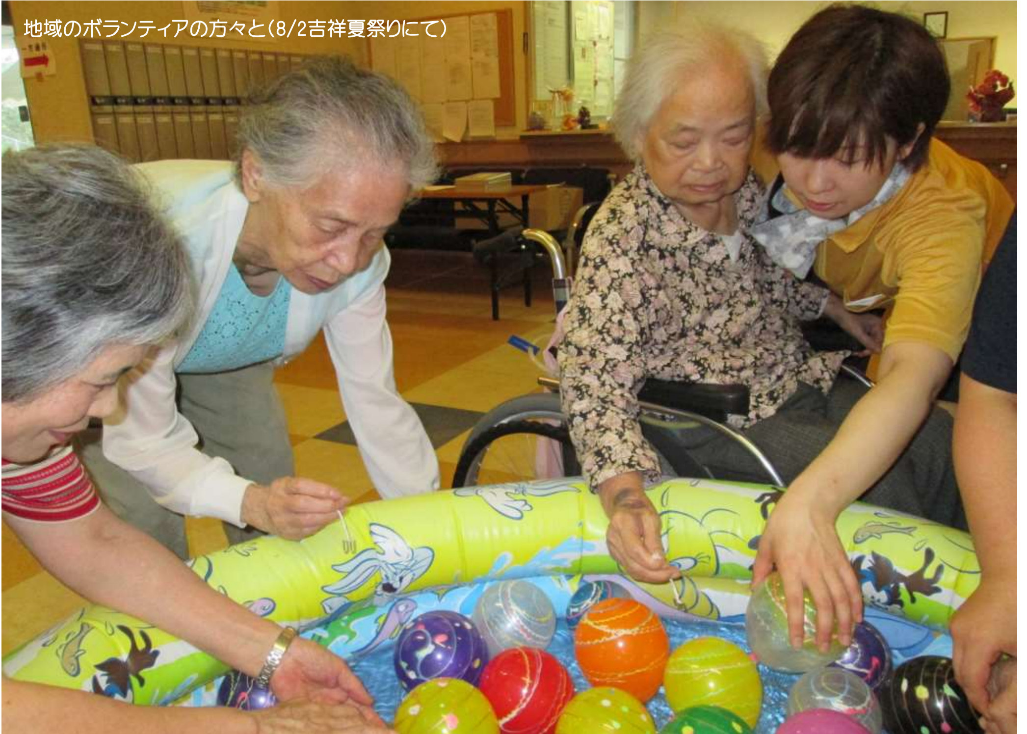
地域のボランティアの方々と(8/2吉祥夏祭りにて)

住み慣れた地域で、 施設のご利用者のご家族が、そして多くの人が 幸せを感じられる空間を創造します。