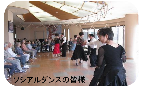
ソーシャルダンスの皆様