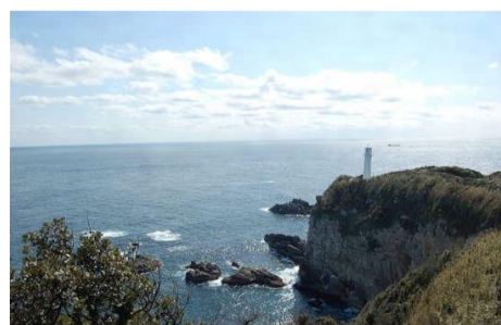
▲足摺岬。どこまでも続く水平線。