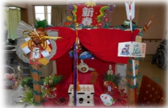
お正月バージョン

特定ではエレベーター横のカウンターに、春夏秋冬の季節に応じたディスプレイを施しています。利用者様が歩かれたとき、「もう、子供の日やな」「花が綺麗な」等、楽しそうに話されます。それを見ている私たちもその言葉に励まされますし、より一層喜んで頂けるよう、色彩や配置を工夫しています。昨今は新型コロナウイルスの事で暗い話ばかりですが、こうした事で少しでも心が和んで頂ければ幸いです。