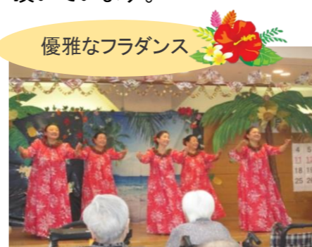
優雅なフラダンス

イベントの花形は誕生会や季節行事です。皆様に楽しんで頂けるよう、力を入れています。誕生会は毎月行われ、ボランティアの方々に来所いただき、普段は見られない出し物を披露して頂いています。