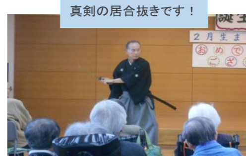
真剣の居合抜きです！