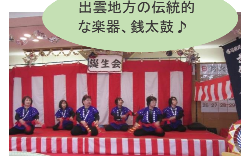
出雲地方の伝統的な楽器、銭太鼓♪

季節行事の代表は吉祥祭です。名前の通り、これは吉祥全体でのお祭りです。ボランティアの方の出し物だけでなく、輪投げや金魚すくい等、縁日気分を全館を盛り上げます。