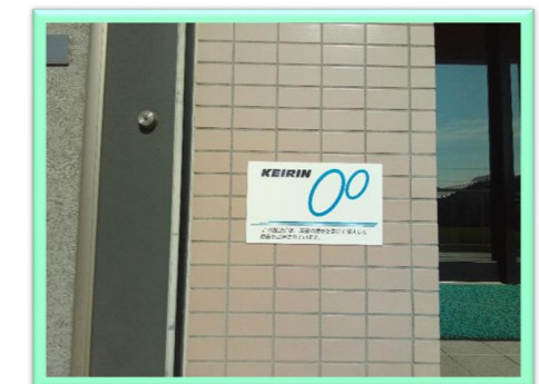
● グループホーム玄関の様子