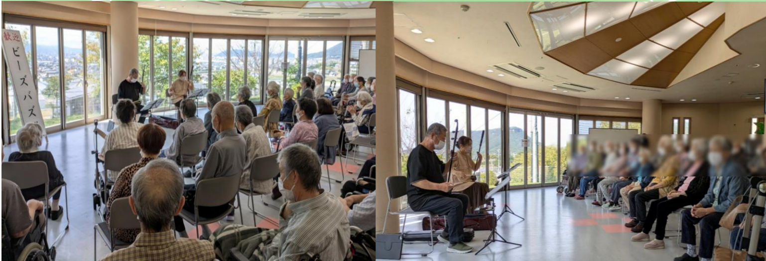
二胡という中国の楽器を演奏され、吉祥祭を大いに盛り上げてくださいました。